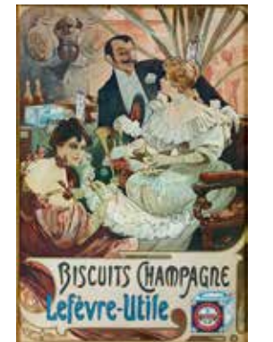
香檳餅乾 Alfons MUCHA 捷克 (1860-1939)