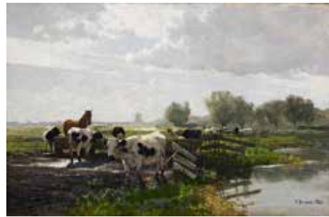
池塘邊的牛群 Hermann BAISCH 德國 (1846-1894)