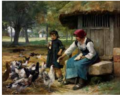
餵食時刻 Julien DUPRÉ 法國 (1851-1910)