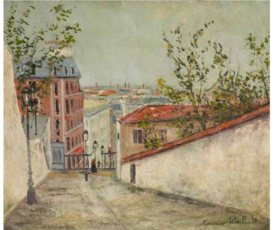
蒙馬特的蒙賽尼街 Maurice UTRILLO 法國 (1883-1955)