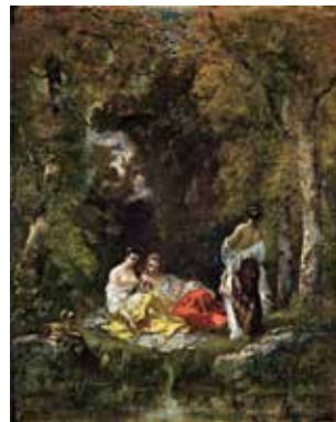
林間浴女 Narcisse-Virgile DIAZ de la PEÑA 法國 (1807-1876)