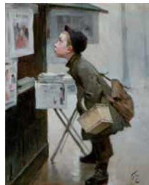
新新聞 Henri Jules Jean GEOFFROY 法國 (1853-1924)