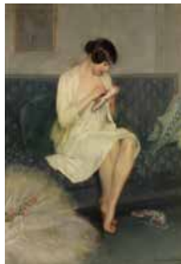
補鞋的舞者 Pierre CARRIER-BELLEUSE 法國 (1851-1932)