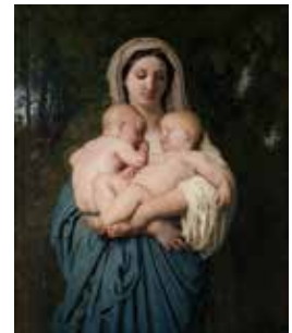
母愛 William Adolphe BOUGUEREAU 法國 (1825-1905)