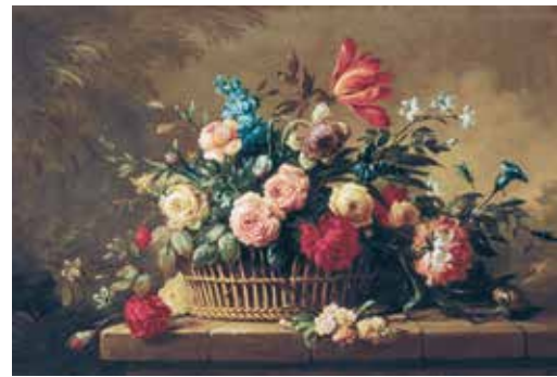
玫瑰與花束 Manner of Jean-Baptiste MONNOYER