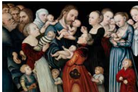
將小孩都帶到我這兒來 Lucas CRANACH the Younger 德國 (1515-1586)