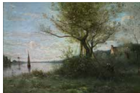
島嶼尖端的渡船 Jean Camille COROT 法國 (1796-1875)