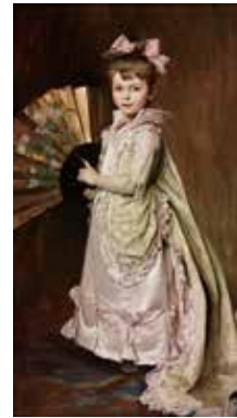
小候爵公主 Albert AUBLET 法國 (1851-1938)