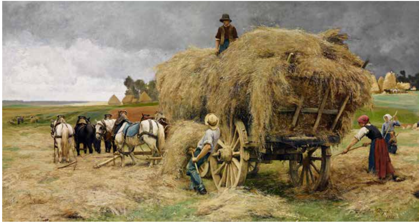
豐收 Julien DUPRÉ 法國 (1851-1910)