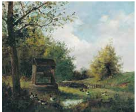
井邊的雞棚 Eugène GALIEN-LALOUÉ 法國 (1854-1941)