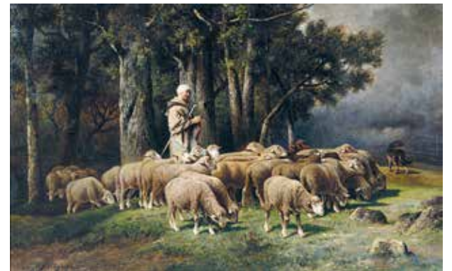
牧羊女 Charles JACQUE 法國 (1813-1894)