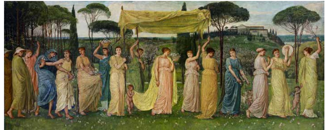
春的降臨 Walter CRANE 英國 (1845-1915)