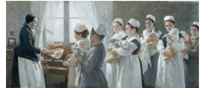
等候量體重 Timoleon Marie LOBRICHON 法國 (1831-1914)