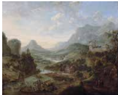
萊茵河景色 Jan GRIFFIER 荷蘭 (1645-1718)