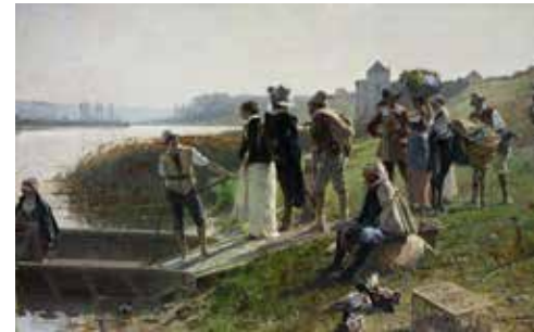
渡船 Adrien MOREAU 法國 (1843-1906)