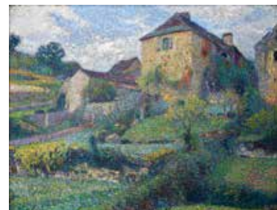
南法小鎮的房子 Henri MARTIN 法國 (1860-1943)