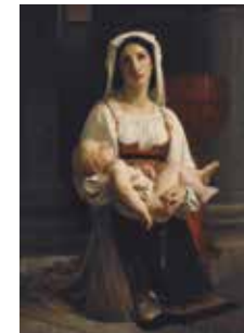
祈願 William Adolphe BOUGUEREAU 法國 (1825-1905)