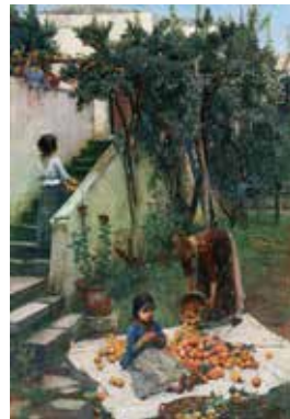
採收橘子 John William WATERHOUSE, R.A. 英國 (1849-1917)