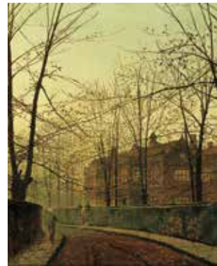
金色秋天 John Atkinson GRIMSHAW 英國 (1836-1893)