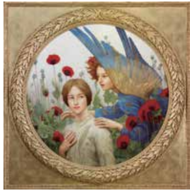
信息 Thomas Cooper GOTCH 英國 (1854-1931)