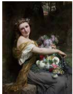
黛妮希雅 Pierre Auguste COT 法國 (1837-1883)