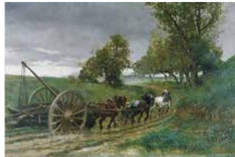
運木材的馬車 Charles Edouard FRÈRE 法國 (1837-1894)