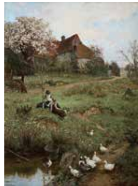
五月 Sir Ernest Albert WATERLOW, R.A. 英國 (1850-1919)