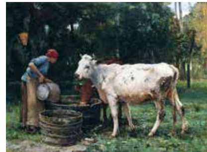
農婦與牛 Julien DUPRÉ 法國 (1851-1910)