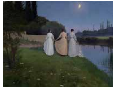
向月亮致敬 Georges GIRARDOT 法國 (d. 1914)