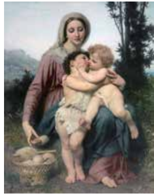
聖母子與施洗者約翰 William BOUGUEREAU 法國 (1825-1905)