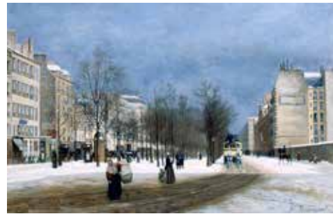
巴堤諾勒大道的雪景 Adrien E. F. BOUSSENOT 法國 (d. 1902)