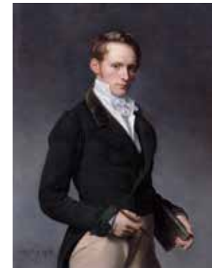
藝術家肖像 Michel Martin DROLLING 法國 (1786-1851)