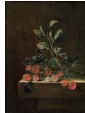
紅醋栗 Adriaen COORTE 荷蘭 (1665-After 1707)