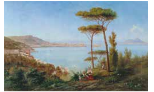
拿坡里的海灣景象 Achille SOLARI 義大利 (b. 1835)