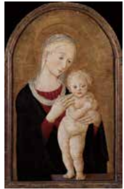
聖母與聖嬰 Pierfrancesco 風格 義大利 (1844/5-After 1497)