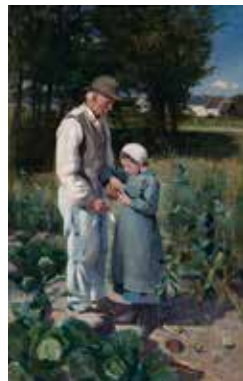
田野中 Edward STOTT 英國 (1859-1918)