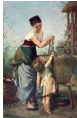
媽媽的小幫手 Timoleon-Marie LOBRICHON 法國 (1831-1914)