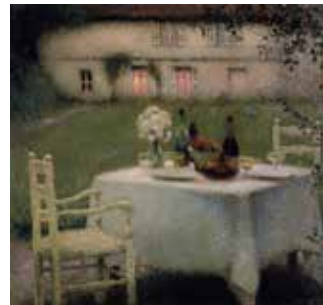
薄暮中的花園餐桌 Henri le SIDANER 英國 (1862-1939)