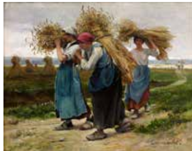
拾穗婦女 Julien DUPRÉ 法國 (1851-1910)