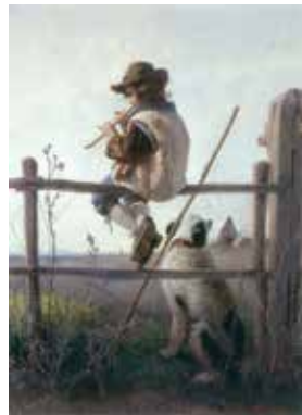
牧童 Ludwig PASSINI 奧地利 (1832-1903)