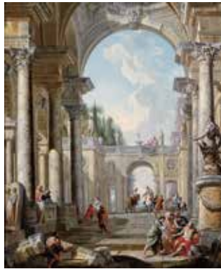
貝利薩流士於君士坦丁堡門前 Giovanni Paolo PANINI 義大利 (1692-1765)