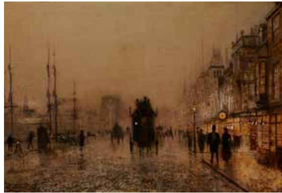
布努姆勒街，格拉斯哥 John Atkinson GRIMSHAW 英國 (1836-1893)