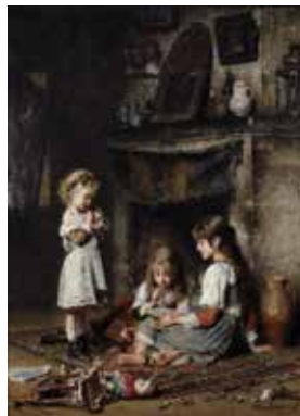
吹泡泡 Alexis HARLAMOFF 蘇俄 (1840-1922/25)