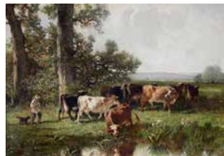
牛群戲水 Constant TROYON 法國 (1810-1865)