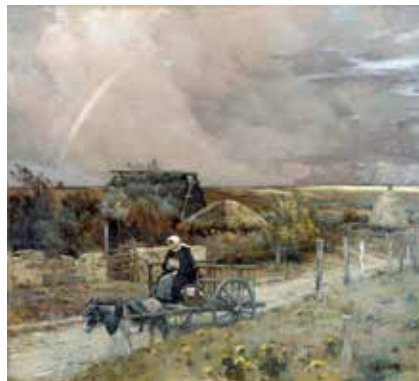
穹蒼的圓虹 Jean Charles CAZIN 法國 (1841-1901)