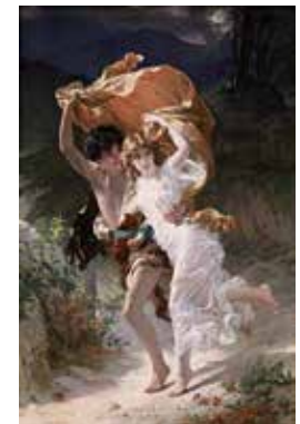
暴風雨 Pierre Auguste COT or his workshop 法國 (1837-1883)