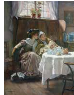
村莊裡的新人 William A. BREAKSPEARE 英國 (1855/56-1914)