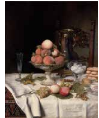
餐桌上的水蜜桃 Jules LARCHER 法國 (b. 1849)