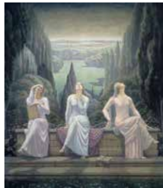
沈默學院 Jean DELVILLE 比利時 (1867-1953)