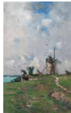
海邊的磨坊 Antoine GUILLEMET 法國 (1843-1918)