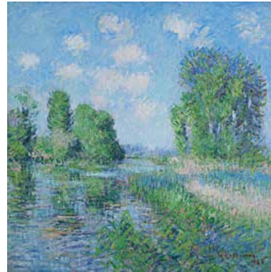
河景 Gustave LOISEAU 法國 (1865-1935)