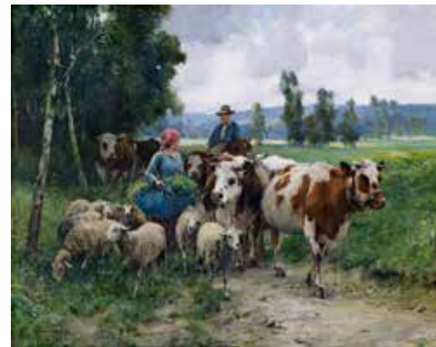
市集歸來 Julien DUPRÉ 法國 (1851-1910)