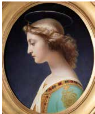
天使加百列 Paul DELAROCHE 法國 (1797-1856)