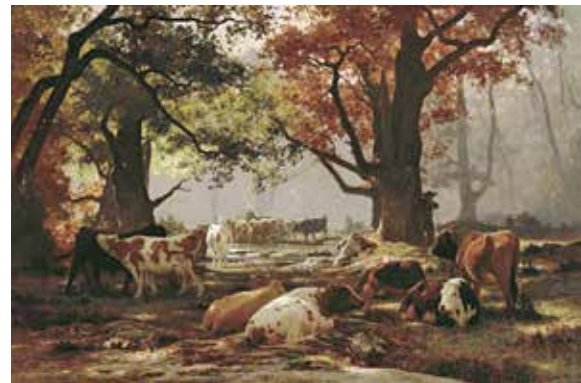
林間景色 Auguste BONHEUR 法國 (1824-1884)