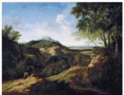
羅馬的坎帕納風景 Gaspard DUGHET 義大利 (1615-1675)