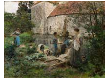
洗衣婦 Leon Augustin LHERMITTE 法國 (1844-1925)